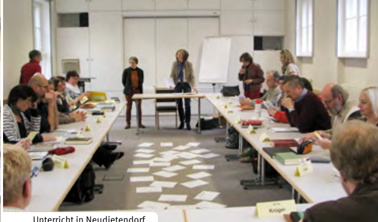
Unterricht in Neudietendorf