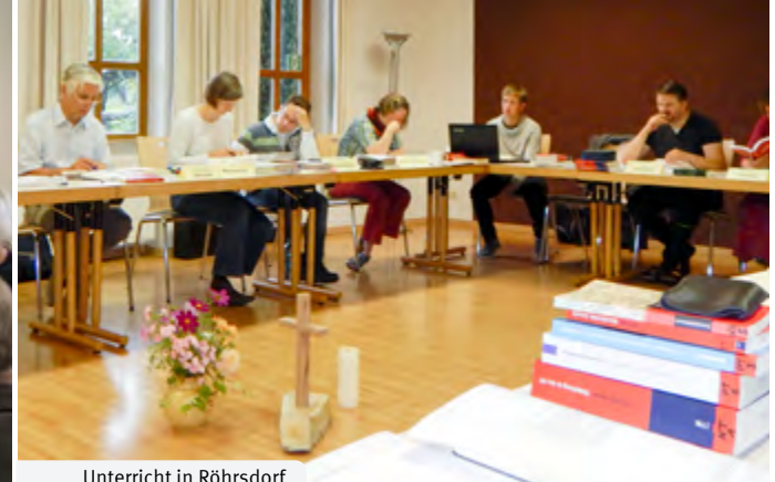
Unterricht in Röhrsdorf

Anmeldeschluss für Kurs 30 ist der 31. Juli 2017.