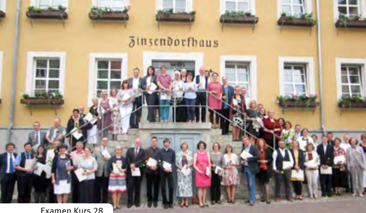
Examen Kurs 28